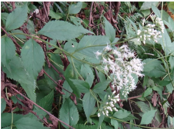
ヒヨドリバナ 葉は長楕円形で、白い頭花が散房状に咲く。