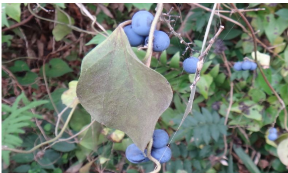
アオツツラフジ 葉は広卵形で、数個づつ液果が粉藍色に熟す。