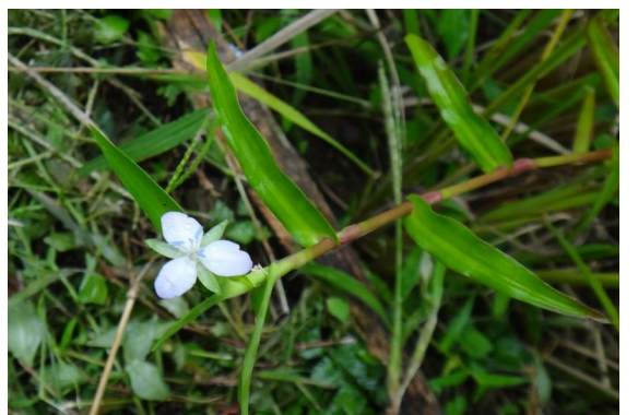
イボクサ ツユクサに似ているが、葉は披針形で、3弁の花が平開する。