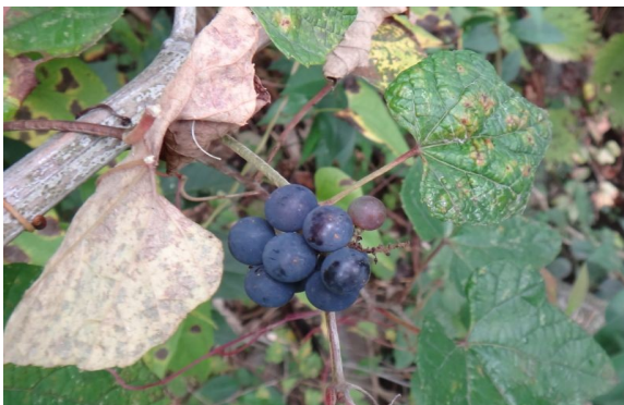
エビズル 葉は掌状に浅裂し、総状につく液果が粉黒色に熟す。