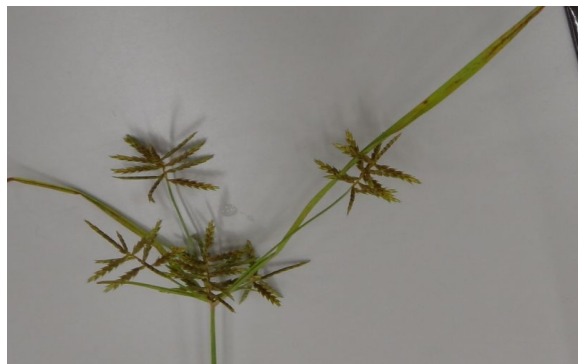
チャガヤツリ 枝分かれ段数が少なく小さいカヤツリグサのようである。