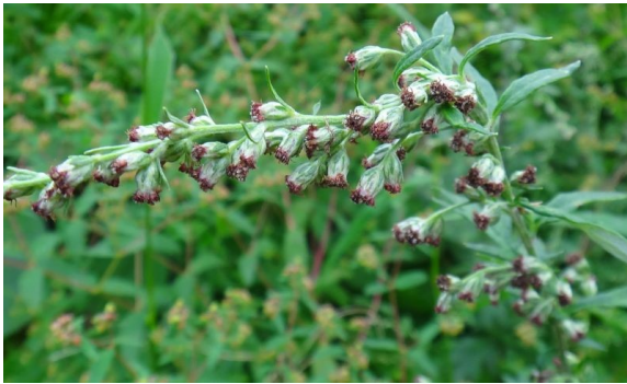
ヨモギ 葉裏に綿毛があり、鐘形の花を円錐状につける。