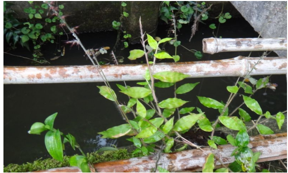
チヂミザサ 笹状の葉の縁が縮み、芒の長い小穂がまばらな穂状に並ぶ。