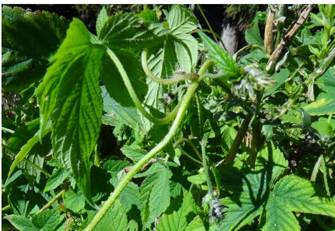
カナムグラ 葉は掌状に裂け、茎に棘があり、花序は緑色で苞が何枚もある。