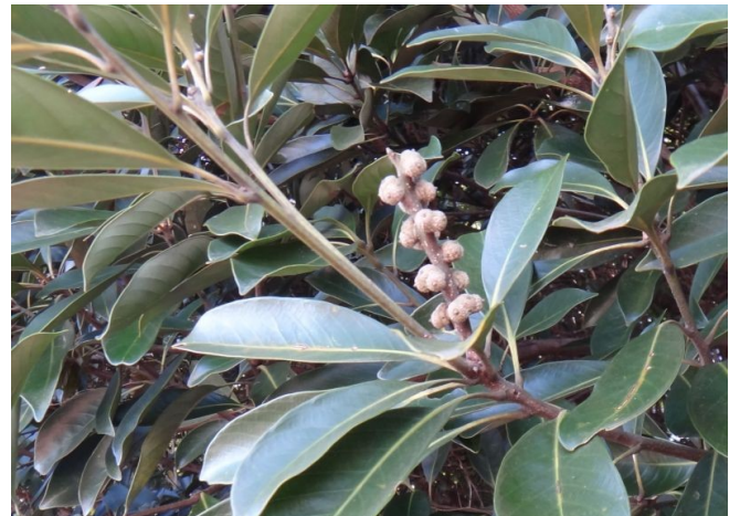
マテバシイ 葉は厚手で、花序枝にドングリが育ちつつある。