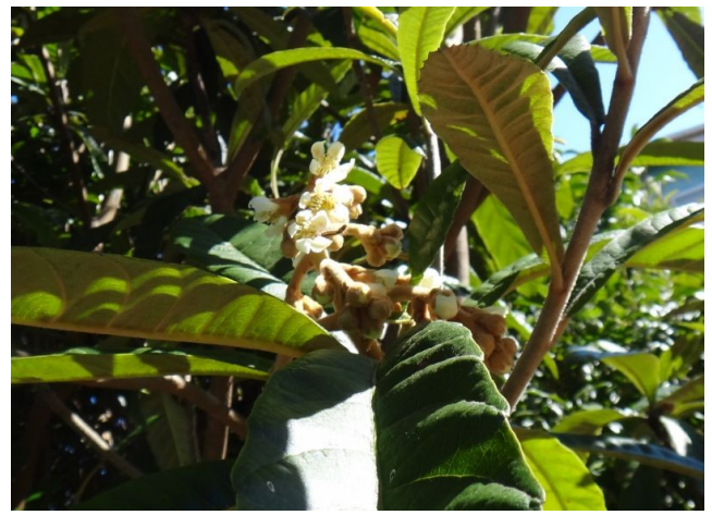
ビワ 花序などに褐色の綿毛が密生し、白い5弁花が咲く。