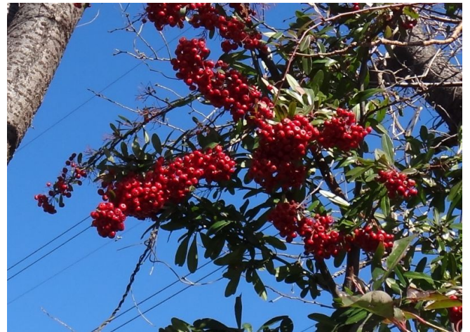
ピラカンザ 葉は長楕円形で、花は白く、赤い梨状果が密集してつく。