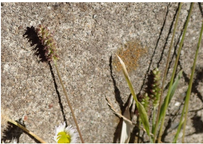
ヌメリグサ 穂は円柱状で小穂が密生し、毛はない。