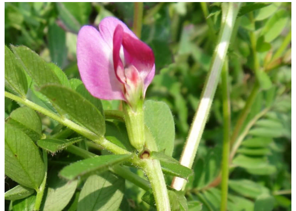
カラスノエンドウ つるをのぼして紅色の蝶形花をつける。花の直下のくぼみは蜜腺。