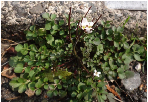
タネツケバナ 奇数羽状複葉が根生し、早春に白い花が咲く。