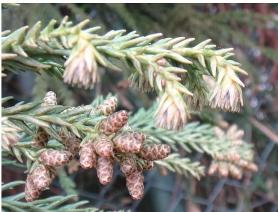
スギ 下の雄花は淡褐色になって目立つが、上の雌花は目立たない。