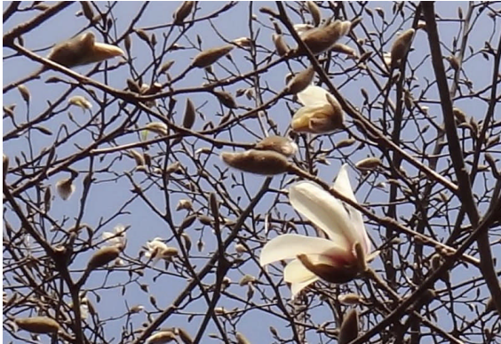
コブシ 他の木々にさきがけて、白い花を上向きに開く。