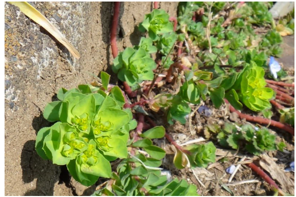
トウダイグサ 杯状の総苞葉の中に黄色い花が咲く。