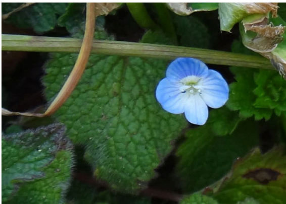
オオイヌノフグリ 葉は卵形で、晴れた日に瑠璃色で青い筋のある4弁花が咲く。