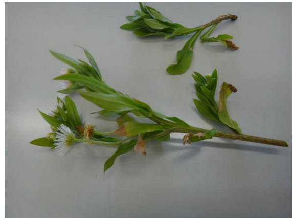
ヘラバヒメジョオン ヒメジョオンにくらべ、葉がへら状となり、鋸歯も目立たない。