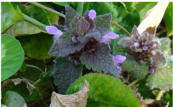
ヒメオドリコソウ 葉に細毛が密生し、淡紅色で唇形の花が葉腋に咲く。