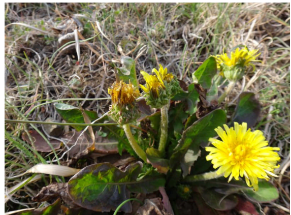
カントウタンポポ 花の下部にある総苞片が直立する。(セイヨウタンポポは反り返る。)