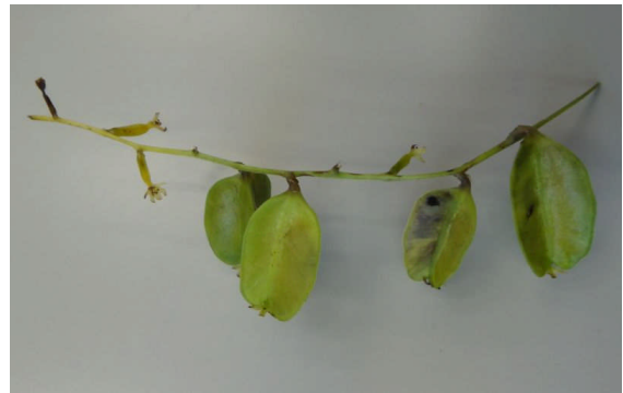
オニドコロ 大きな3翼のある楕円形の蒴果が熟すと上部が3つに割れる。