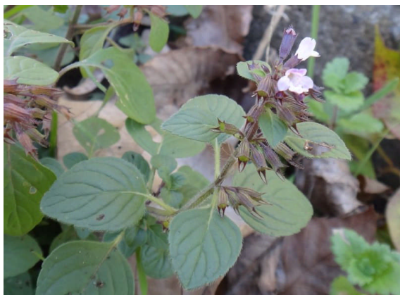
イヌコウジュ 似たヒメジソにくらべ、鋸歯が浅くて数も約7個と少ない。