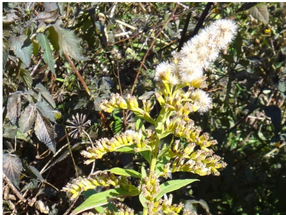
セイタカアワダチソウ 背丈より高くのび、黄色い花をつけ、白い冠毛がある。