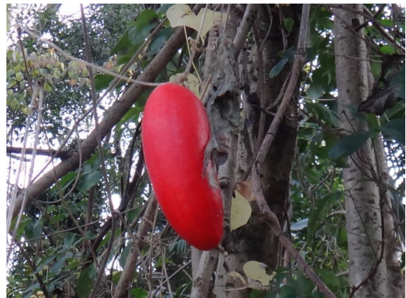
カラスウリ 普通は典型的な楕円形なのに、これはかなり細長い。