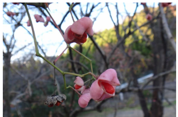
マユミ 蒴果は膨らみの4つある饅頭形で、熟すと赤い仮種皮に包まれた種が現れる。