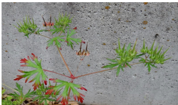
アメリカフウロ 葉は掌状に裂け、果実には針状の突起が上向きにつく。