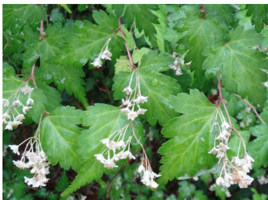
コゴメウツギ 小さい白い花の総が葉にかぶさるように咲く。