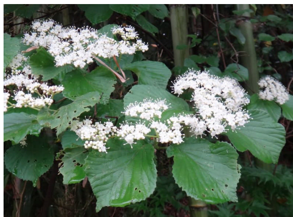
ガマズミ 小さい白い花が散房状に咲く。