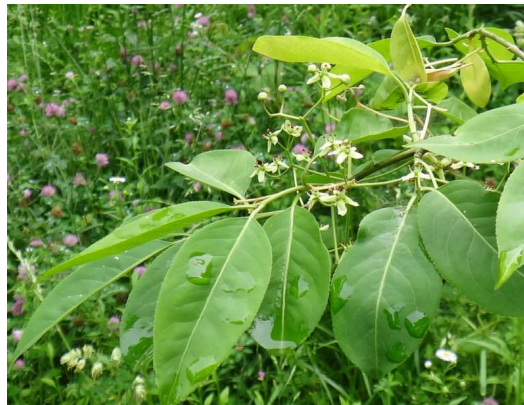
マユミ 緑白色の小さな花が上向きに咲く。