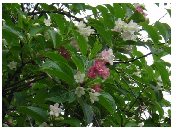
ハコネウツギ 漏斗状の花が白から紅色に変色してゆく。