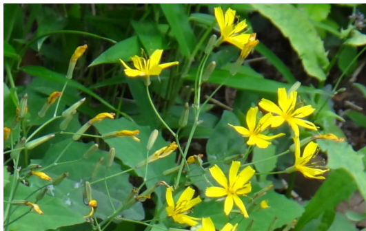
ニガナ 黄色く細長い花弁が5, 6枚広がり、茎を切ると苦い乳液が出る。