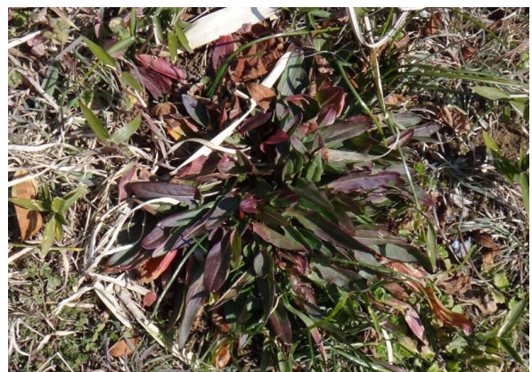
スイバ ロゼット（円盤状に並んだ根生葉）