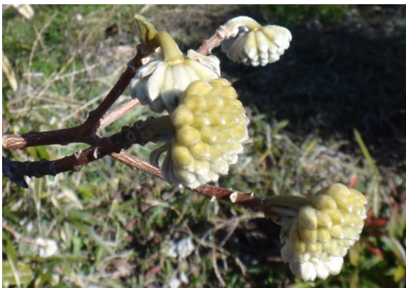
ミツマタ 晩秋から蕾をつけている。