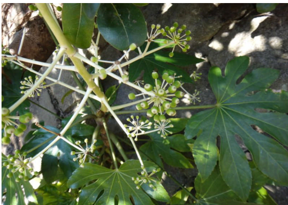
ヤツデ 丸い果実が放射状につく。