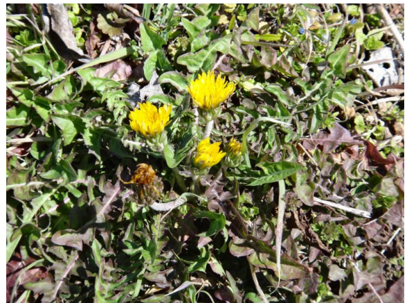
カントウタンポポ 寒いので背が低い。