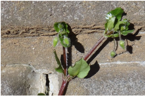
コハコベ 茎が赤い（ミドリハコベは緑色）。 ぶら下がっているのは果実。