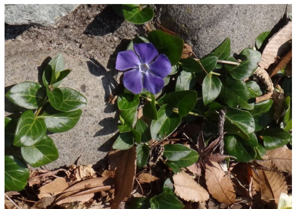
ツルニチニチソウ 一年中元気な帰化植物。