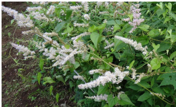
チダケサシ 小さい淡紅色の花が多数咲く。