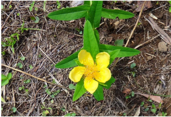
トモエソウ 黄色い花弁が四つ巴となって咲く。