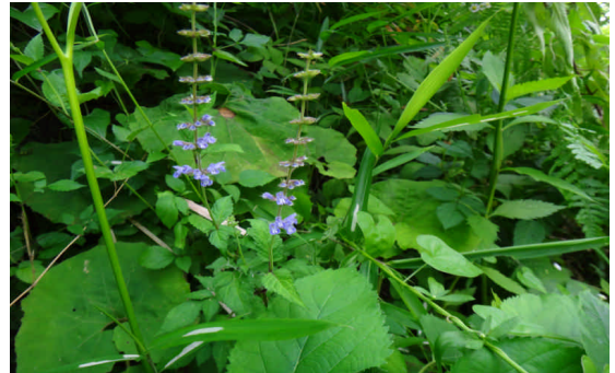
アキノタムラソウ 奇数羽状複葉で、青紫色の唇形の花が数段輪生する。