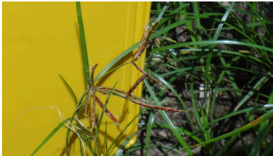
ハマスゲ 葉は細くてつやがあり、小穂は赤褐色で細長い。