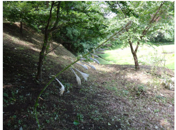
ギボウシ 大きな卵形の葉が根生し、高い花茎に漏斗状の花が咲く。