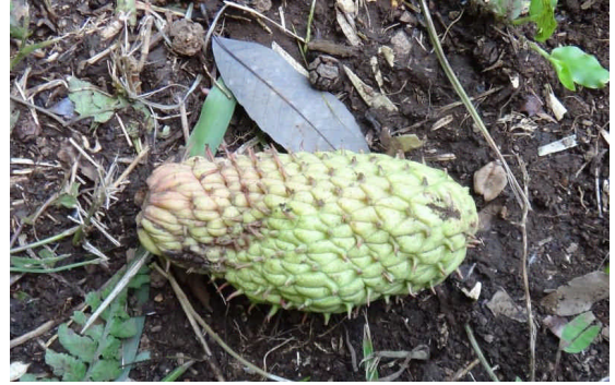
ホオノキの実 大きな果実が落ちていた。