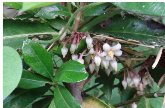
マンリョウ 小さい5弁花が下向きに咲く。