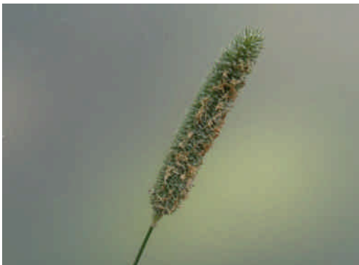
オオアワガエリ 直立する大きい花茎に淡緑色の小穂を密集してつける。