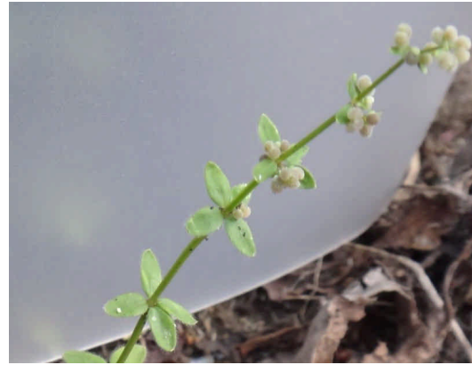
ヒメヨツバムグラ 長さ1センチ弱の葉が4輪生し、1ミリ以下の丸い分果がつく。