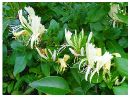
スイカズラ 葉腋に芳香のある唇形の花が咲き白から黄色へと変色してゆく。