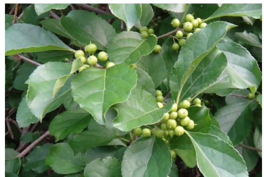
ツルウメモドキ 葉は楕円形で、丸い蒴果がつき、秋に割れて赤い中身が現れる。