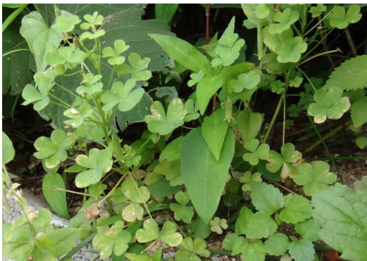
オッタチカタバミ 地下茎は横這いするが地上茎は立ち上がる。