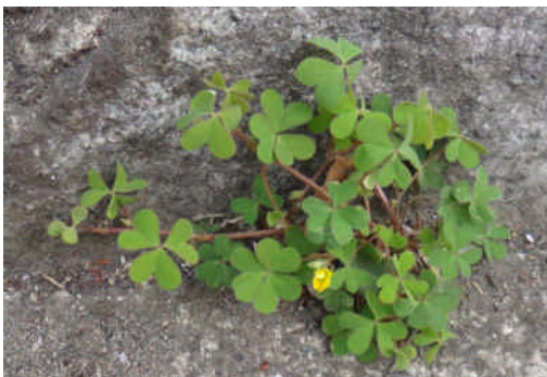
カタバミ 茎は横這いし、柄の長い三つ葉を出し黄色い花が咲く。