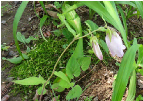
ホタルブクロ 梅雨期の林床などで親指ぐらいの鐘形の花を咲かせる。