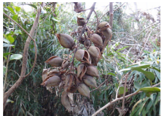
キリ 翼のついた小さい種がたくさん出る。