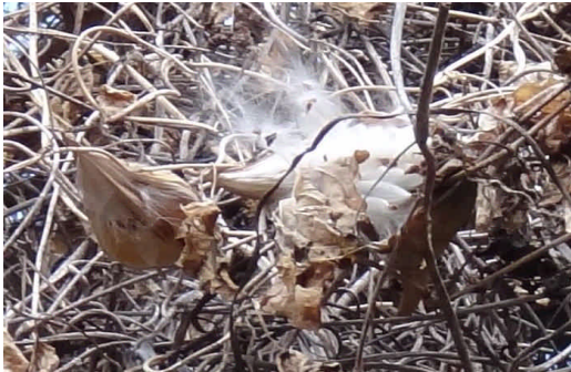
ガガイモ 牛の角のような実がはじけて白い冠毛が現れる。