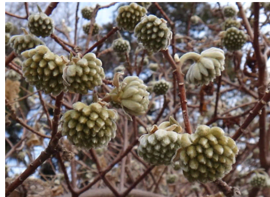
ミツマタ 晩秋から早春まで蕾を付けている。