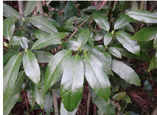
アオキ雄木 雄木は実をつけないが、雄木がないと雌木に実がつかない。