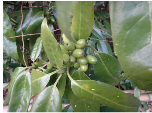
アオキ雌木 半日日陰でもよく育つ。実は熟すと赤くなる。