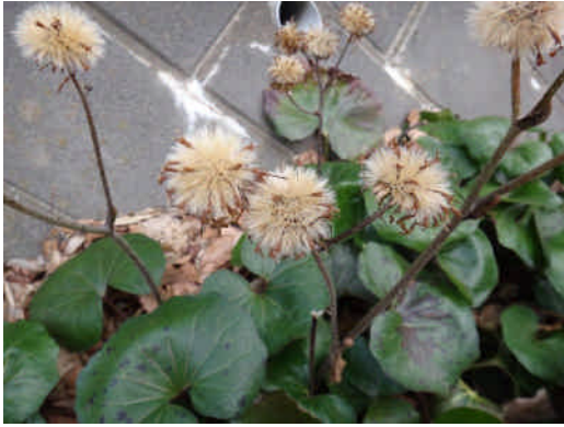
ツワブキ 葉は丸くて光沢があり、種には淡褐色の冠毛がある。