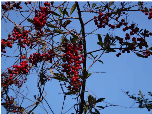
ピラカンサ 花は白く実は赤い(橙色や黄色の実もある)。