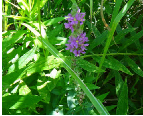
エゾミソハギ 葉は茎を抱く。