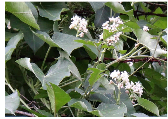
ガガイモ 葉は細長いハート形で、淡紫色の花をつける。