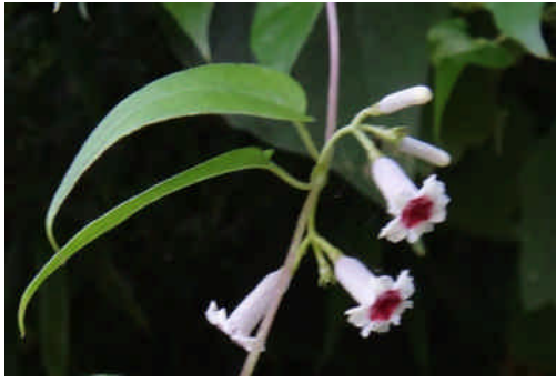
ヘクソカズラ 細長い釣鐘形で中心部の赤い花をつける。