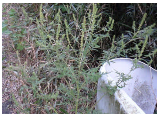
ブクサ 高さは1メートル以上あり、葉は深く切れ込んで羽状になる。