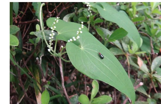
ヤマノイモ 白い丸い花のついた花序を葉腋から数本上向きにのばす。