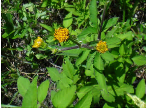
コセンダングサ 舌状花はほとんど見えない。(センダングサでは見える)