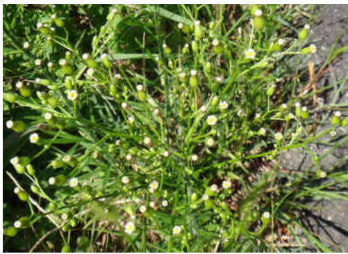
ヒメムカシヨモギ 白い舌状花がはっきり見える。