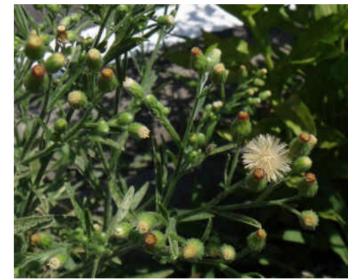
オオアレチノギク 舌状花が殆ど見えない。