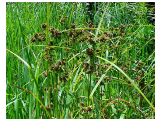
マツカサススキ 緑褐色の花が頭状に集まる。東京都の保護対象種。