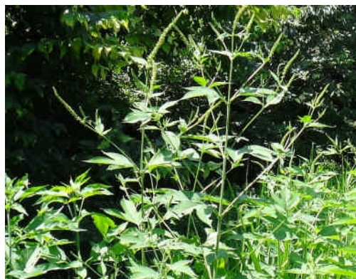
オオブクサ 高さは2メートル近くあり、葉は掌状に切れ込みがある。