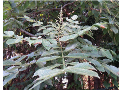
ヌルデ 奇数羽状複葉で、葉軸に翼があり、小さい花を円錐状につける。