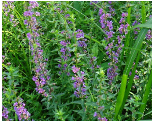
ミソハギ 葉は茎を抱かない。