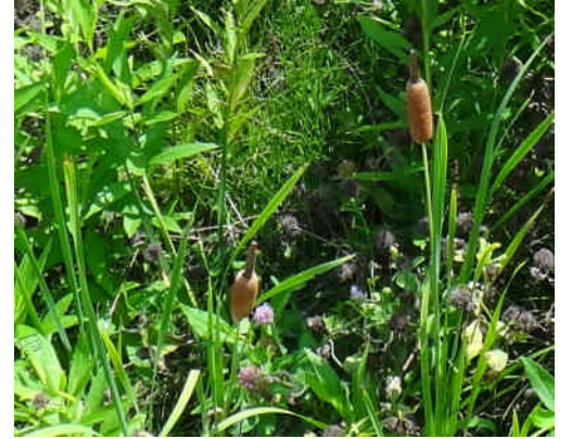
コガマ 穂は10センチぐらいと、ガマにくらべて半分ぐらいである。