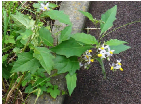
ワルナスビ 茎や葉に棘がある。