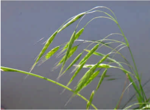
スズメノチャヒキ 細長くて丸い小穂が垂れ下がる。