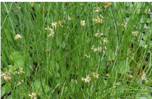
イ 苞が茎と同じ形なので、茎の途中に花が咲くように見える。