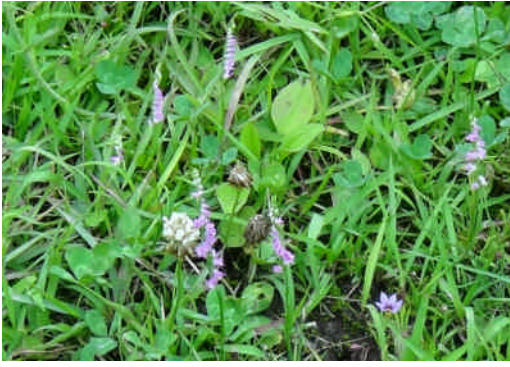
ネジバナ 淡紫色の花が螺旋状につく。右巻きと左巻きがある。