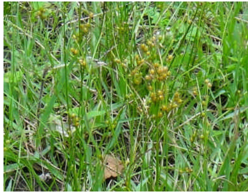
クサイ 淡褐色の楕円形の蒴果がつく。