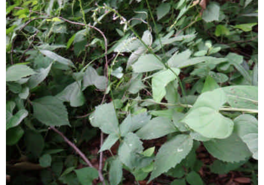
ヌスビトハビ 3出複葉で、細い茎に小さな蝶形花をまばらにつける。