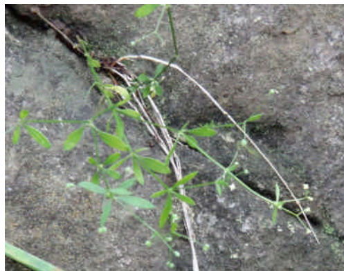
ヤブムグラ 四角い茎に葉が輪生する。自然環境の良い所に育つ。