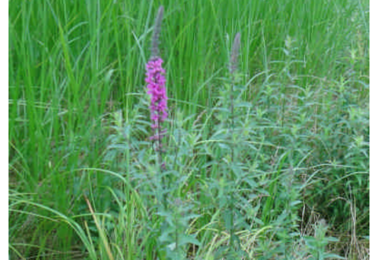
エゾミソハギ 直立する茎を紅紫色の花が取り巻く。葉は茎を抱く。