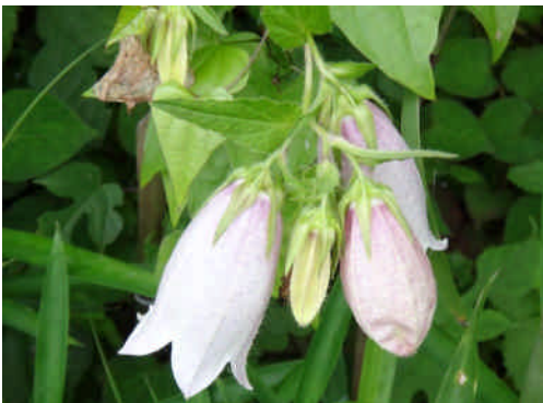
ホタルブクロ 釣鐘形の花をつけ、萼の切れ込み部に反り返りがある。