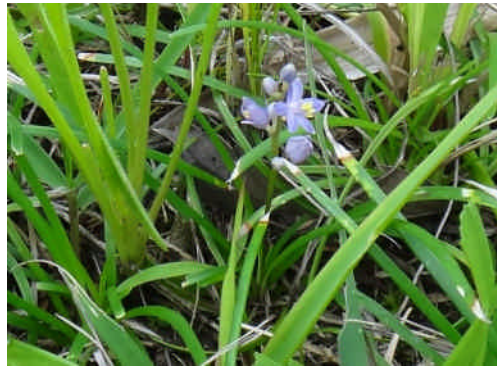
ヒメヤブラン 淡紫色の花が上向きにつく。ジャノヒゲの花は下向き。