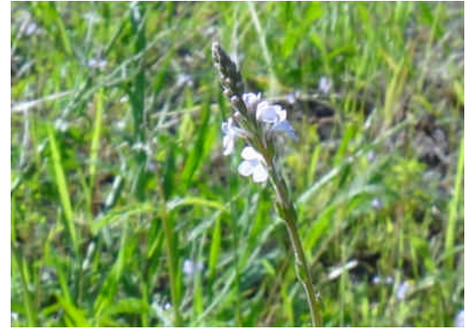
クマツツラ 淡紅紫色の小さい5弁花をつける。