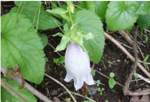
ヤマホタルブクロ 萼に反り返り部がない。