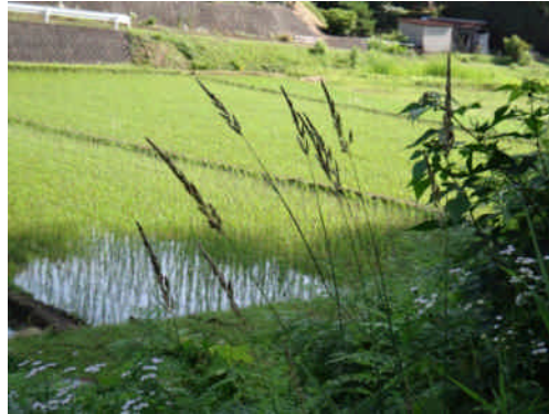
クサヨシ 円柱形の穂は直立し、花期には小穂の枝が一時開く。