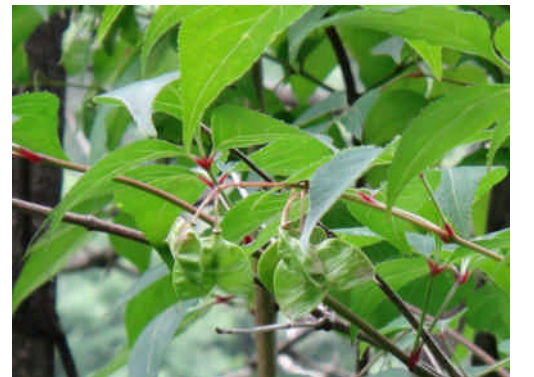
ミツバウツギ 葉は3出複葉で、実は袴のような形。