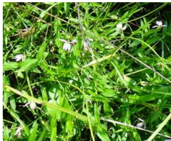
アゼムシロ 花弁は横向きに2枚、下向きに3枚。