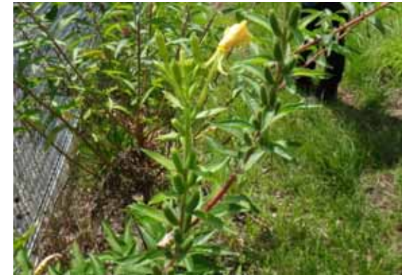
アレチマツヨイグサ 花は黄色く実は円柱形