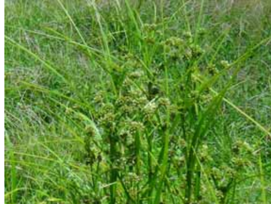
マツカサススキ 小穂が球形に集まる。東京都の保護対象種。