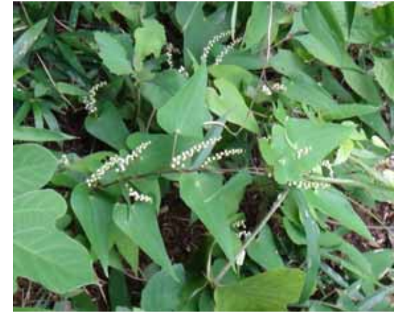
ヤマノイモ 葉は三角状で白い花穂が直立する。