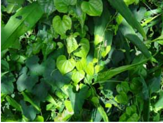
オニドコロ 葉は丸くて先がとがる。