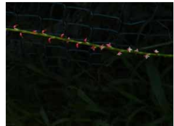
ミズヒキ 赤い小さい花がまばらに咲く。