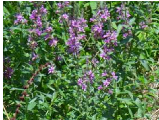
エゾミソハギ 葉が茎をいだく。