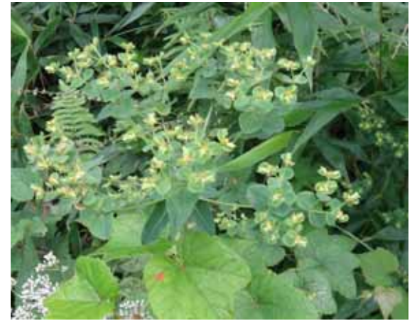
タカトウダイ 葉が5枚輪生し、分枝した小枝の先に杯状の花を咲かせる。