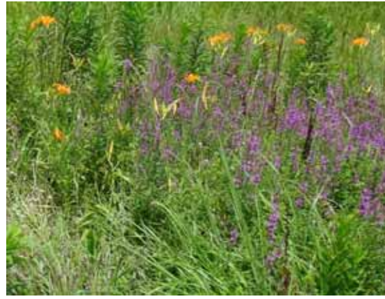
ミソハギ 葉は茎をいだかない。黄色いのはノカンゾウ。