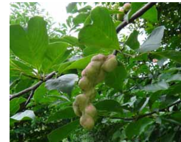
コブシ 握り拳のこぶのような実がなる。