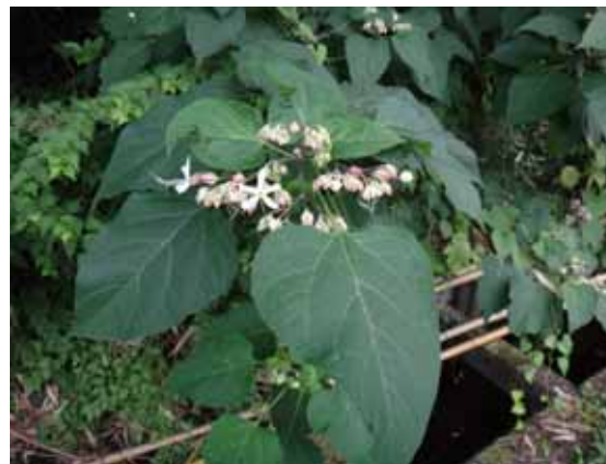
クサギ 花の少ない盛夏に薄紅色の花を咲かせる。