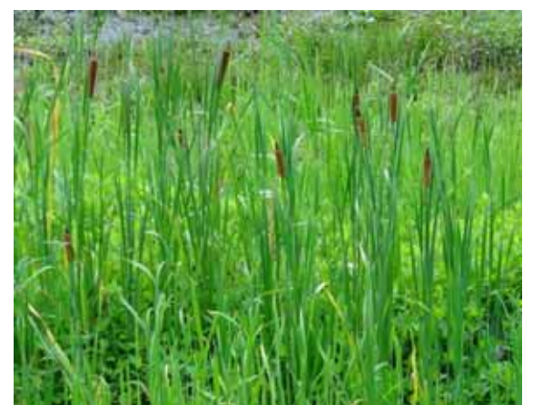
コガマ 雄花穂の下に円柱形の雌花穂がつく。ガマより小さい。