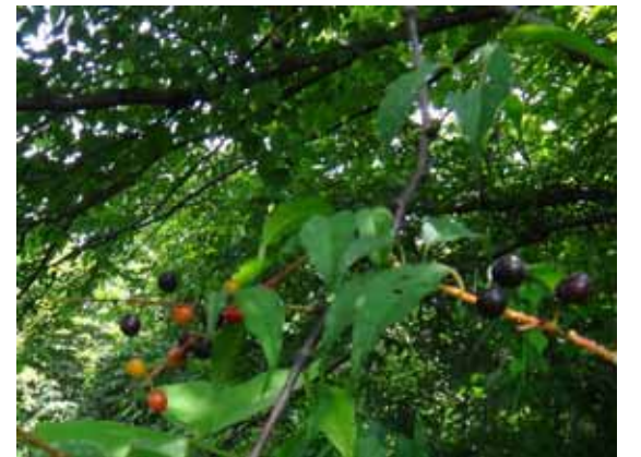
ウワミズザクラ 実は熟れると黒紫になる。野鳥に食べられてまばらになる。