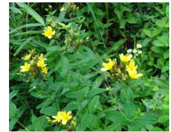
オトギリソウ 葉が十字対生(段ごとに90度ずれる)し、黄色い5弁花が咲く。