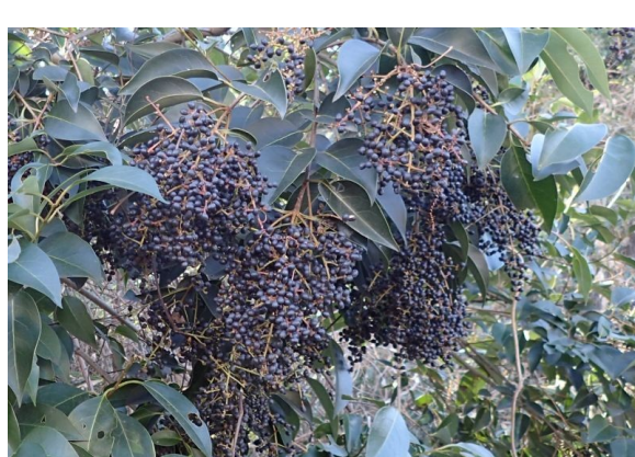
トウネズミモチ ネズミの糞のような実を枝もたわわにつける。