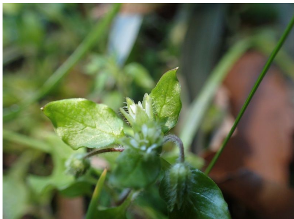
コハコベ ミドリハコベにくらべ、小ぶりで茎が紫色を帯びる。