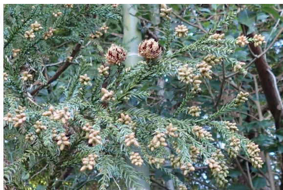
スギ 割れ目のある球は果実で、枝先の楕円形のは雄花。