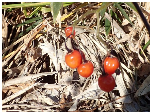
ヒヨドリジョウゴ つる性で、枝分かれした花枝に朱色の実をつける。