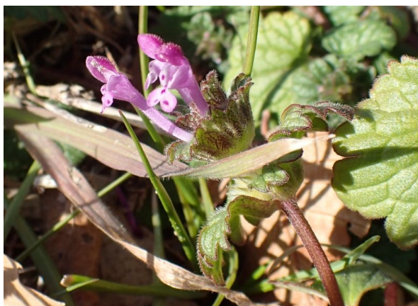
ホトケノザ 花は唇形で、対生する葉が仏の座る蓮座のようである。