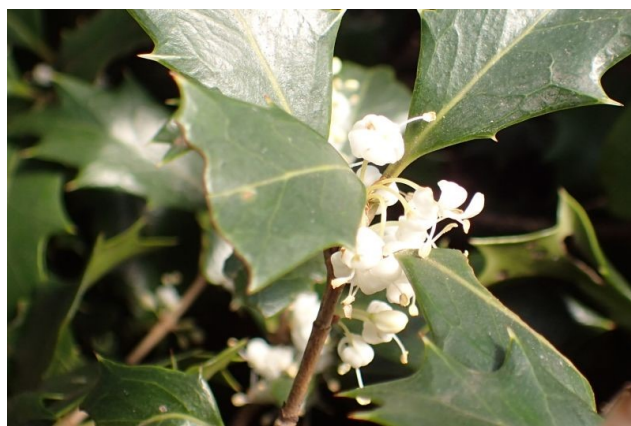
ヒイラギ 葉に針状鋸歯があり、白い花弁が4枚反り返る。