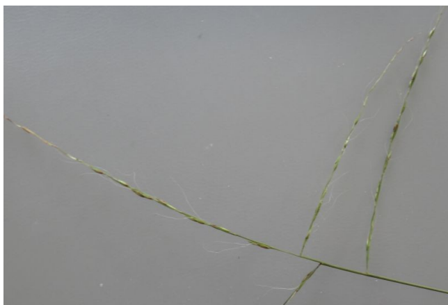
ササガヤ 花序枝が横に伸び、小穂から長い芒がゆらゆらと出る。