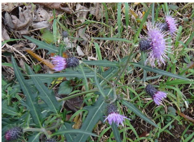
トネアザミ 葉に針状鋸歯があり、総苞片が反り返る。