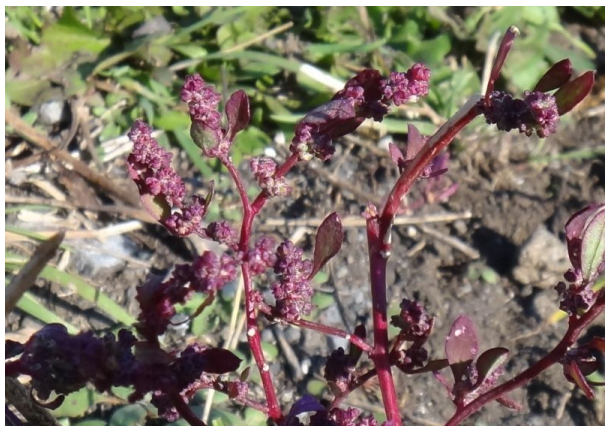
アカザ 赤い果皮に包まれた小さい果実が密集してつく。