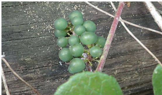
エビヅル 小さなブドウのような果実ができる。