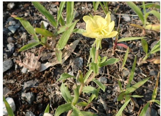
コマツヨイグサ 花は黄色く、葉は細長く、果実は棒状。