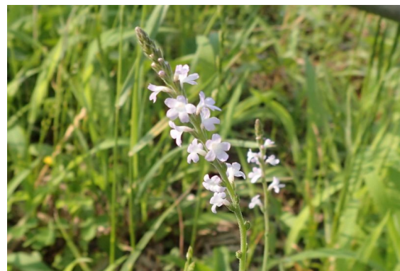
クマツヅラ 葉は羽状に裂け、淡紅色の5弁花が下から上へと咲いてゆく。