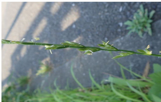
ホソムギ 小穂が花軸に沿って互生し、葯を出している。