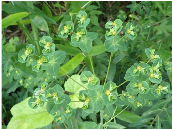
タカトウダイ 輪生する花序枝の先に小さい杯状花序ができる。