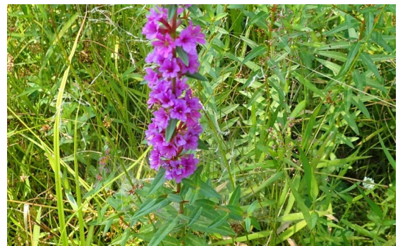
ミソハギ 直立する花茎に赤紫色の花が穂状に咲く。