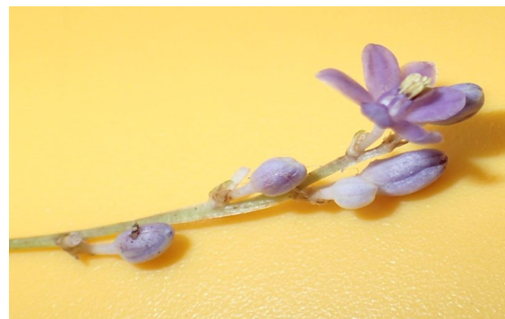
ヒメヤブラン 葉は線形で、淡紅色で6弁の花をつける。