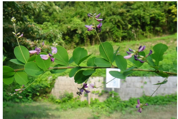
ヤマハギ 小葉は丸くて花序は葉より長くのび、枝はあまり垂れない。