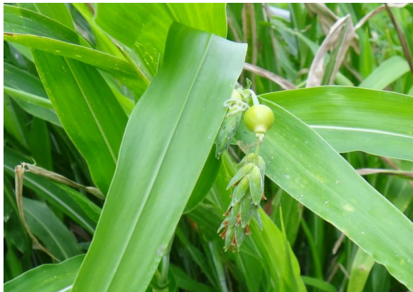
ジュズダマ 外に出ているのは雄花で、雌花は壺形の苞鞘の中にある。