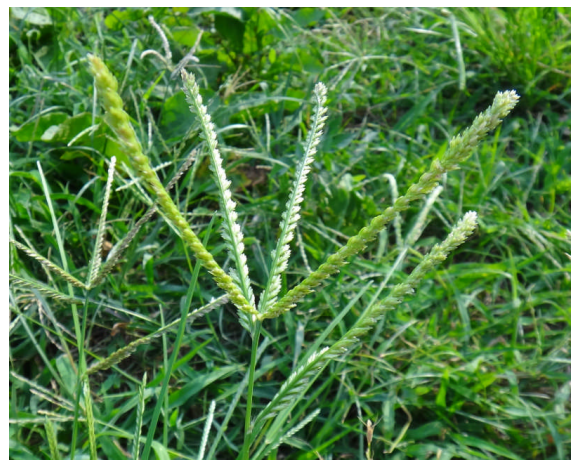
オヒシバ 茎先から太い花序枝が放射状に出る。