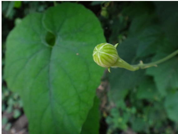
カラスウリ の蕾。花は夜開いて夜明け前にしぼむ。