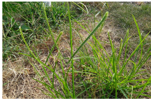
キシウスズメヒエ 茎先から花序枝が2本出る。大正時代に渡来。