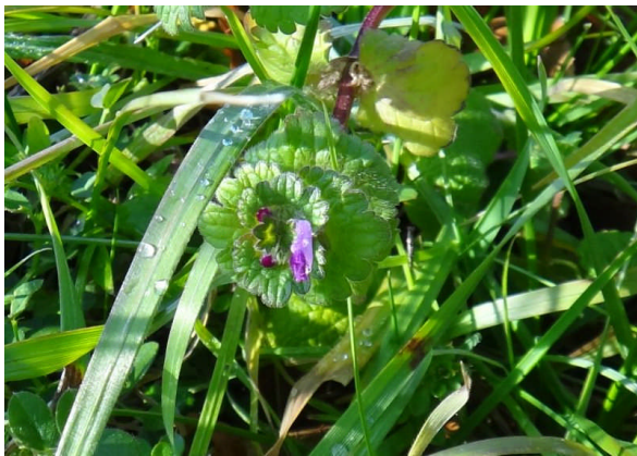
ホトケノザ 丸い蓮華座に唇形で淡紅色 の花が咲く。