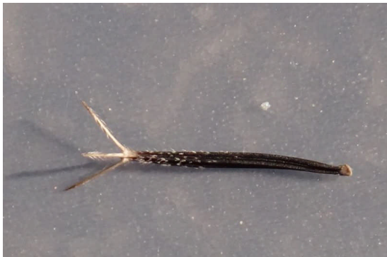
コセンダングサ そう果の棘は3本あり、 逆向きの小さい棘で衣服にくっつく。