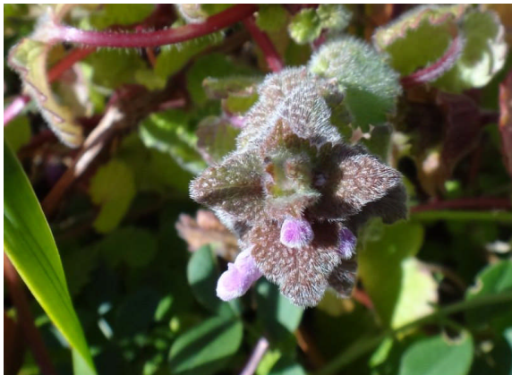
ヒメオドリコソウ 冬は防寒着を着た ように毛深い。