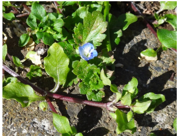
オオイヌノフグリ 太陽の光を受けると 咲く。茎の赤いのはコハコベ。