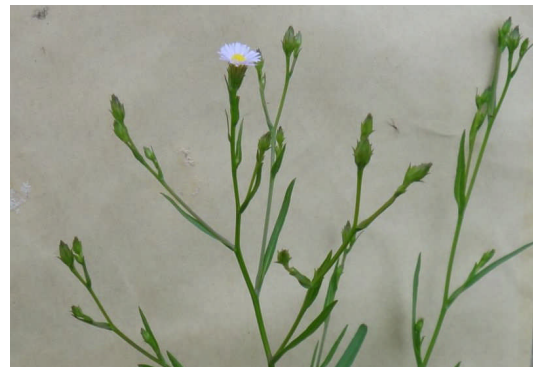
ホウキギク 横広がりに伸びた枝先に白い小さい頭花が咲く。