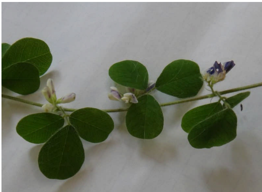
ネコハギ 広卵形の3小葉があり、葉腋に紫斑のある白い豆花が数個咲く。