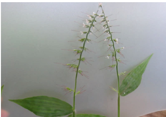
チヂミザサ 笹のような葉の縁が波打ち、長い芒のある小穂が互生する。