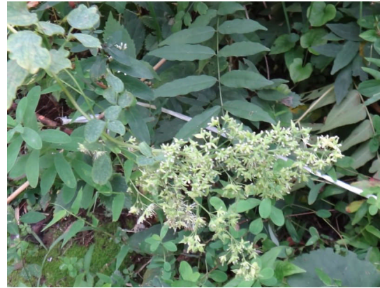
アキカラマツ 葉は楕円形で先が左右対称にへこみ、白い花が円錐状に咲く。