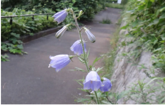
ツリガネニンジン 花は鐘形で先が浅く5裂し、色は淡紫色～白色。