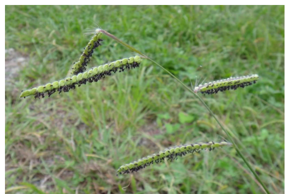
シマスズメノヒエ 互生する花枝に小穂が4列に並ぶ。(スズメノヒエでは2列。)