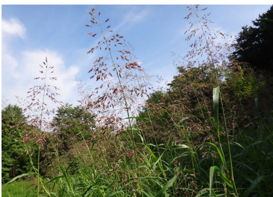
セイバンモロコシ 2メートル近く伸び、褐色の小穂が円錐状につく。