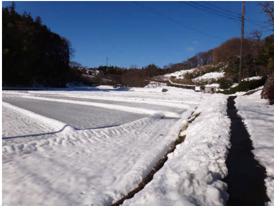
谷戸の雪景色 2月16日: 2日前の雪が まだ20センチ前後残っている。