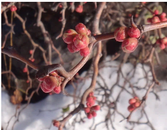
ボケ 蕾がふくらんでいる。