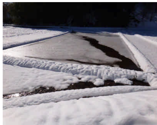
冬水たんぼ よく見ると氷の上に鳥?の 足跡があった。