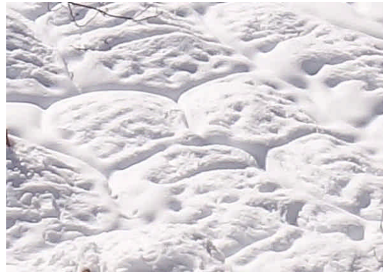
畑 不思議な六角形ができている。