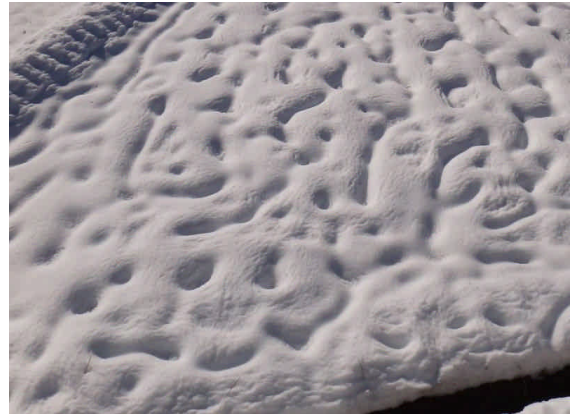
たんぼ おもしろい雪模様がある。