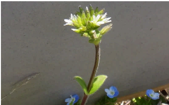
オランダミミナグサ 花は先の割れた5弁で、短時間しか咲かない。