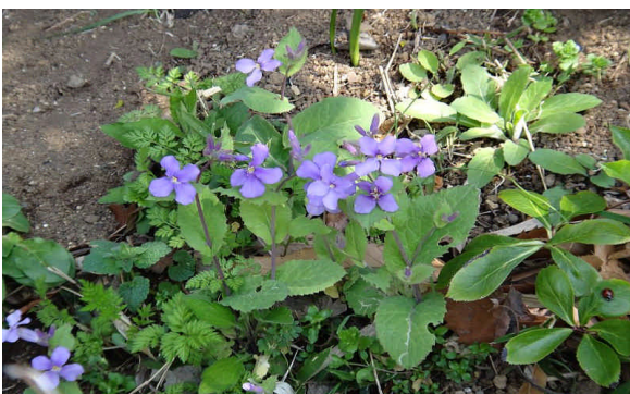
ショカツサイ 花は淡紫色で葉が茎を抱く。