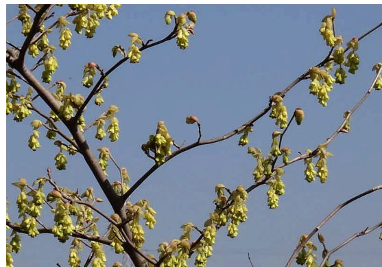
トサミズキ 垂れ下がった穂状花序に黄色い花が10個近くつく。