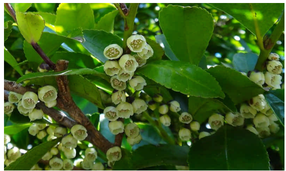
ヒサカキ雄花 小さい鐘形の花を多数下向きにつける。雄しべが多数ある。