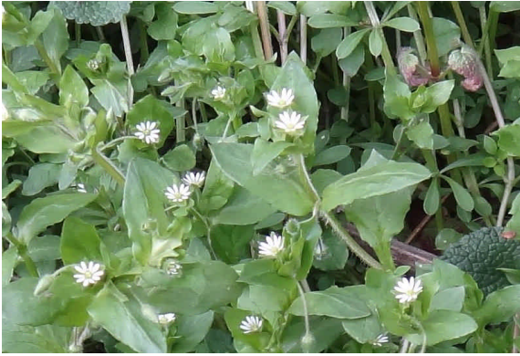
ミドリハコベ 茎が緑色。(コハコベは茎が赤褐色)