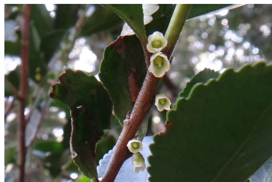
ヒサカキ雌花 花柱の基部がふくらんでいる。