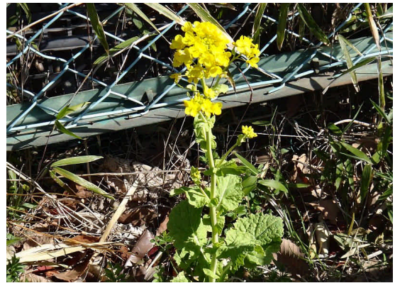
セイヨウアブラナ 黄色い4弁花で、葉と茎は粉白色をおびる。